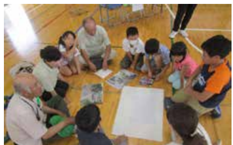
安全マップづくり (安全・防災キャンプ)

その他、登下校等安全指導では風の子安全パトロール（防犯・交通）や安全指導、学習支援活動ではふるさと学習（メロン学習、米作り、歴史探訪、野菜の栽培・販売学習等）や持久走大会への安全確保、読書活動支援では読み語りや図書館整備支援、環境整備支援では愛校作業や風の子農園支援等、地域から学校へ多くの支援をいただいている。今後は、学校から地域への寄与を再考し、協働の質を高めていきたい。