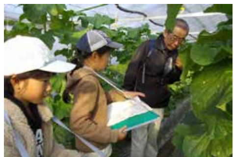
メロン栽培見学 (ふるさと学習)