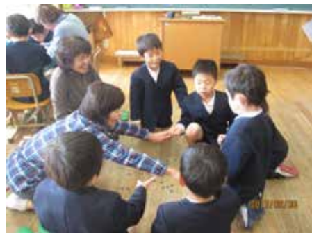
学年で伝承遊びを楽しむ体験 ボランティアの方の指導