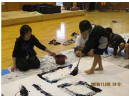
クラブ活動で大帯で書く体験