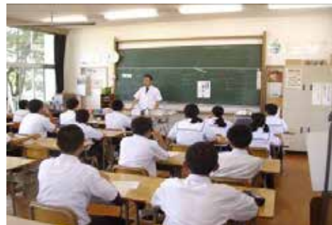
キャリア教育の様子（中学校）