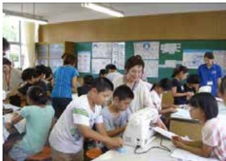
家庭科学習支援の様子（小学校）

香川ランチグループ、有限会社協同ファームによる工場「6次産業」や畜産業に関する講話