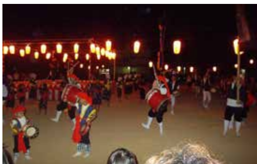
中の町校区盆踊りの夕べ

[その他の活動]・交通安全指導・環境美化活動・クラブ活動指導（お茶・手芸・折り紙・料理）・学校行事への支援・子ども食堂の開催・生涯学習奨励会の開催・盆踊りの夕べの開催