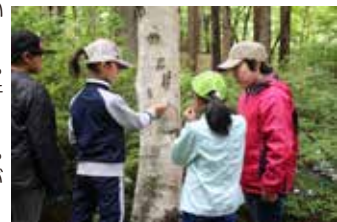
森林学習 （五感を駆使して自然を感じよう）