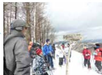
かんじき体験 （冬山路破に挑戦！）