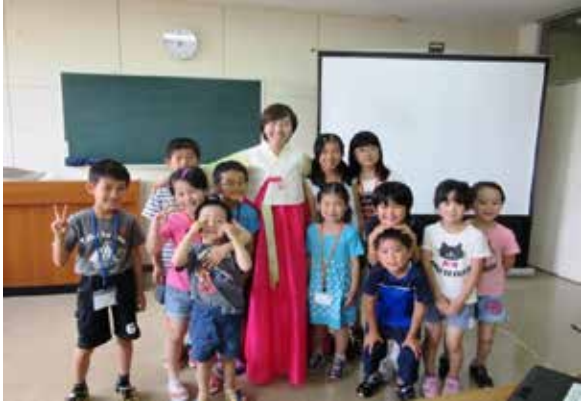
韓国文化を知ろう 国際交流員との交流

九州電力・ながさき土曜学習応援団や五島出前講座の活用、時には商店街からの協力を得ながら大人も集う活動を行っている。