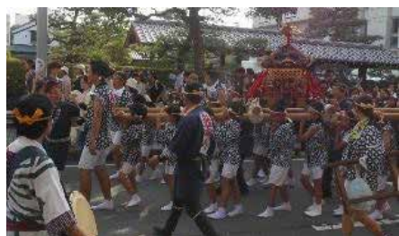
地域支援「子どもたちが地域に出て学ぶ」