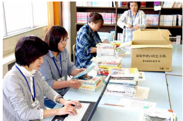
学校図書館の本の管理・修繕