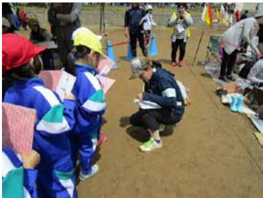
運動会では出番を待つ子供たちの掌握や入賞した子供たちの移動を補助

学習支援（授業時の講師・補助）：国語（毛筆指導）、算数（コース別プリント学習）等