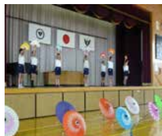
「そくらさくら」を踊る （日本舞踊体験 6 年）