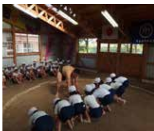
（元力士と大相撲 相撲体験 3 年）

本校は、平成 27 年度に全日本学校歯科保健文部科学大臣賞を受賞するなど歯科保健にも永年取り組んでいる。その推進に当たっても、地域住民を招き一緒に給食を食べ、歯みがきをするなど、地域とともに歯科保健に取り組んでいる。