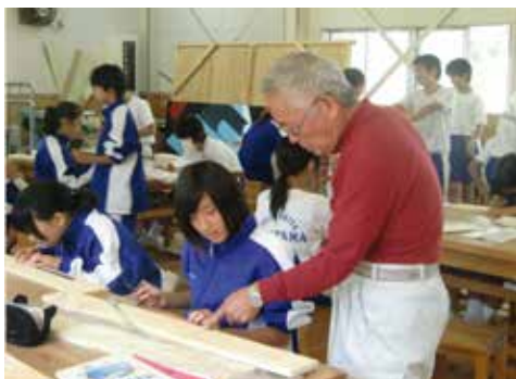
地域の木工さんに教わる

本部を中心に、PDCA サイクルを意識して支援計画、成果・効果を検討するため、学校の課題に迅速に対応することができているのも大きな成果である。学校評価の「地域と協力して子供を育てることを意識した教育活動ができていると思う」では、94.2%の保護者が「そう思う」と答えている。