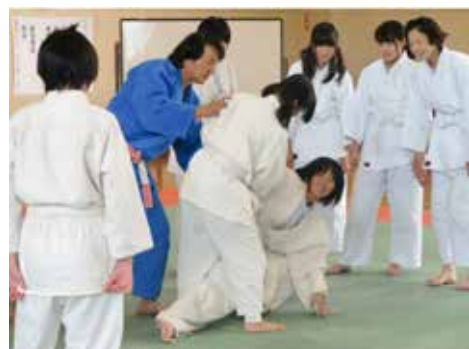
地域の柔道家による支援