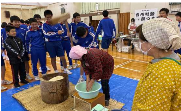
合格祈願餅つき （餅をつく生徒と地域のお手伝いの方々）