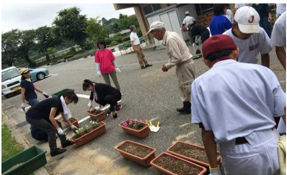
環境整備 （花植え活動）