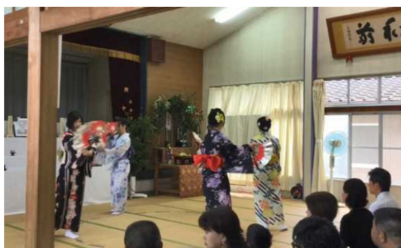
地の石 区中 応の 学学 生区 徒が がの い盆 取踊 りい 組た 。ん め同 だ、 地、 。他 区

1年生の「12Colors」の学習をきっかけに、近年途絶えていた石応地区の盆踊りを地域の方と共に復活させる活動を行った。また、2年生の防災教育で御協力いただいた、「うわじまグランマ」が主催する「子ども食堂」に、生徒がボランティアとして参加した。