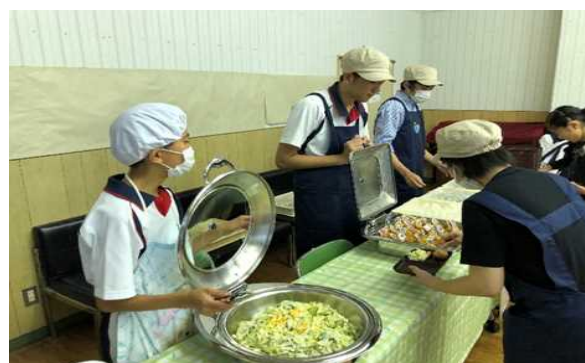
が加子 参ども 加望も した食 募。堂 。り。全 多校 く生 の徒 生に 徒参