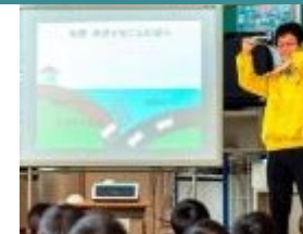
▲災害に備える力を養う「防災教室」