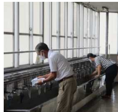
○鳶尾小学校で、手洗い場や玄関などを清掃・消毒する地域住民の方々

厚木市の全市立小学校23校の半数以上において、保護者・地域住民による清掃・消毒が行われている。多くの場合、全児童が帰った放課後に実施しており、作業の参加者はPTAの保護者や地域住民など。