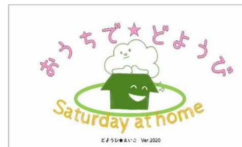
ロゴもオリジナル