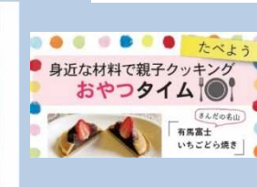
↑ 地域の子どもの教室独自のホームページ