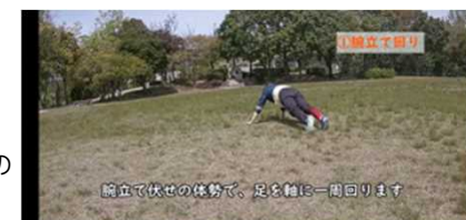
→ 支援者自作の動画配信