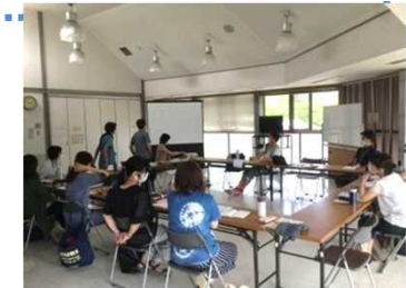
月に一度、コーディネーターが実践を基にミーティングをしている。