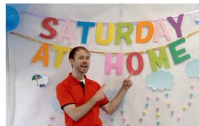
⇐ エピソード1のオープニング

地域資源を活用し、地域に目を向けてもらうきっかけに。 (エピソード5 加茂岩倉遺跡)